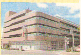
市営パーク城東駐車場